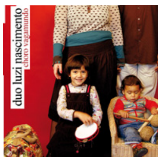
CHORO VAGAMUNDO, 2012 LA RODA