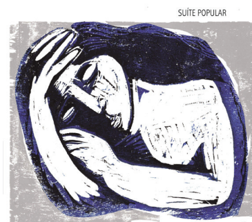
TECA CALAZANS e CAMERATA BRASILIS Suite Popular (Acari Records) Sorti en Déc. 2015

Il était également important d'enregistrer un répertoire de choro et valse-choro chanté, car ce style rarement maîtrisé est ici réinventé dans de nouvelles harmonies et mélodies par des compositeurs et arrangeurs d'aujourd'hui, en pleine possession de leur art.