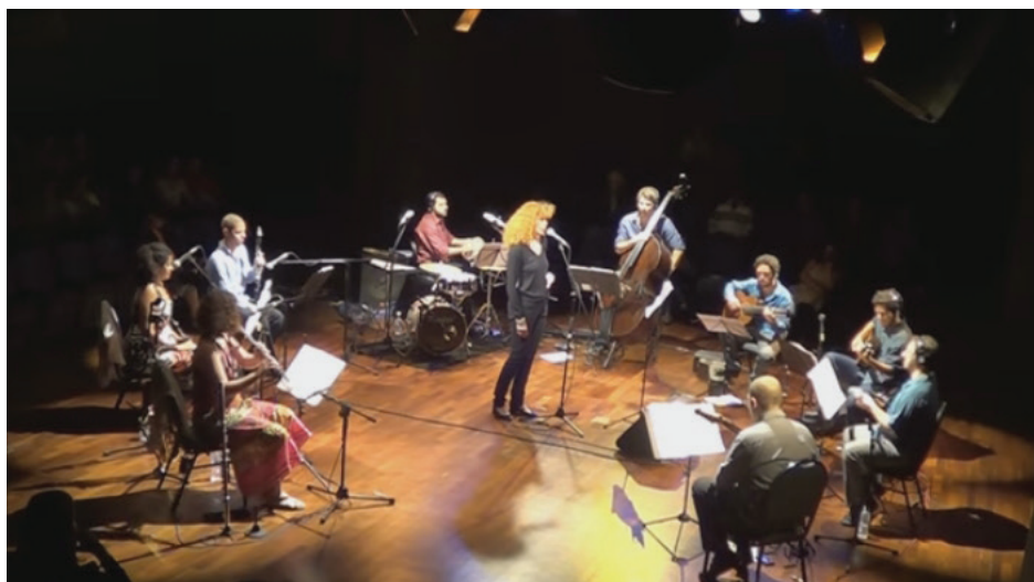
VIDÉO : Sabiá (Sinhô) Cliquez ici