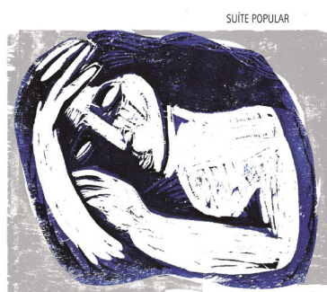
TECA CALAZANS e CAMERATA BRASILIS

ECOUTEZ L'ALBUM "SUITE POPULAR" EN CLIQUANT ICI