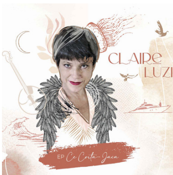
2024 • "Ce corta jaca"