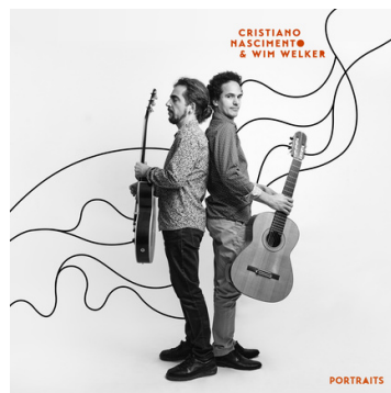
2025 • "Portraits"