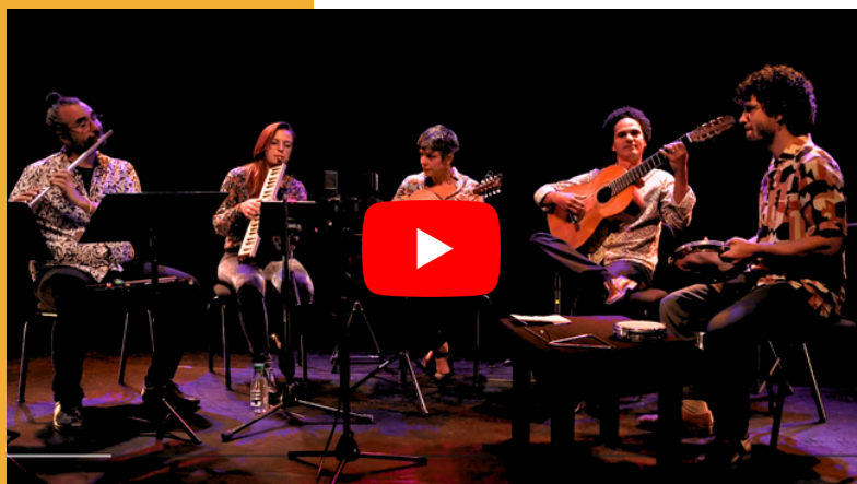
LE BAL DES ÉMIGRÉS - Cité de la musique de Marseille