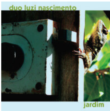
2007 • "Jardim"