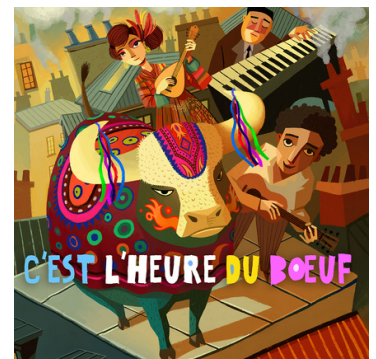
2025 • "C'est l'heure du boeuf"