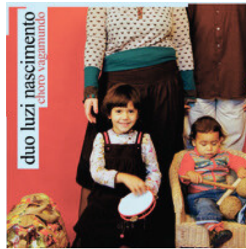
2012 • "Choro Vagamundo"